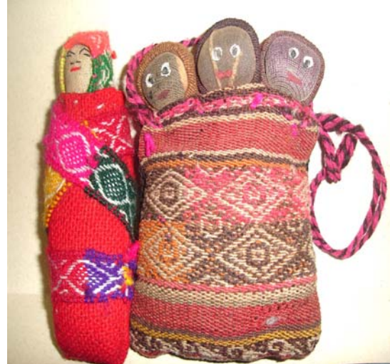
Las Wawas o los bebés

PAIS: De la Región Andina –Bolivia, Perú, Ecuador y parte de Chile-.