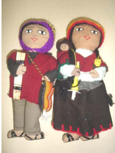
Muñecos: Hombre y Mujer